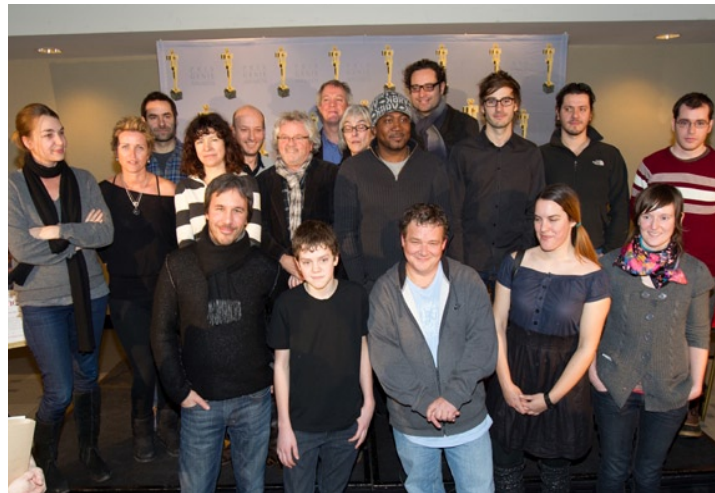
Les finalistes présents lors de la conférence de presse.