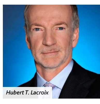
Hubert T. Lacroix

tant en télévision, en cinéma, qu'en médias interactifs. CBC/Radio-Canada compte également doubler ses investissements dans les nouvelles plateformes numériques. Le radiodiffuseur public est ouvert à de nouvelles occasions d'affaires.